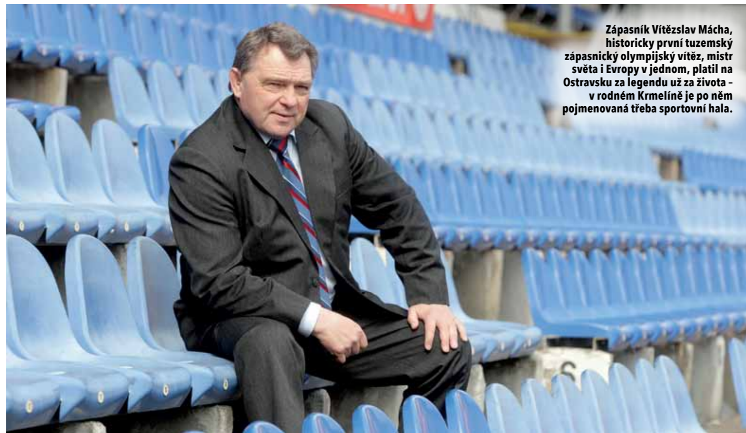
Zápasník Vítězslav Mácha, historicky první tuzemský zápasnický olympijský vítěz, mistr světa i Evropy v jednom, platil na Ostravsku za legendu už za života – v rodném Krmelíně je po něm pojmenovaná třeba sportovní hala.

■ To je mi moc líto. Upřímnou soustrast. Děkuji. Chtěl jsem ale říct, že ta fungující velká rodina a jakési zázemí byly pro tátu taky dost důležité. I pro jeho sportovní úspěchy. Navíc čím byl úspěšnější, tím bylo těch soustředění a závodů stále více. Myslím, že se to i u něj dostalo do stadia,