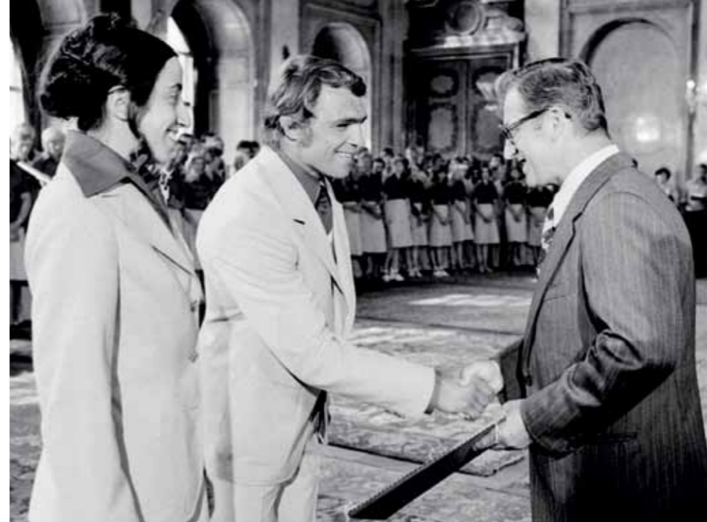
▲ Tehdejší předseda vlády Lubomír Štrougal gratuluje osobně mistru světa i Evropy Vítězslavu Máchovi v roce 1977 „za vzornou reprezentaci socialistické vlasti“.

No, a jako obvykle ho v přípravě na vrcholnou akci něco zradilo. Tentokrát to bylo koleno, které si poranil uprostřed