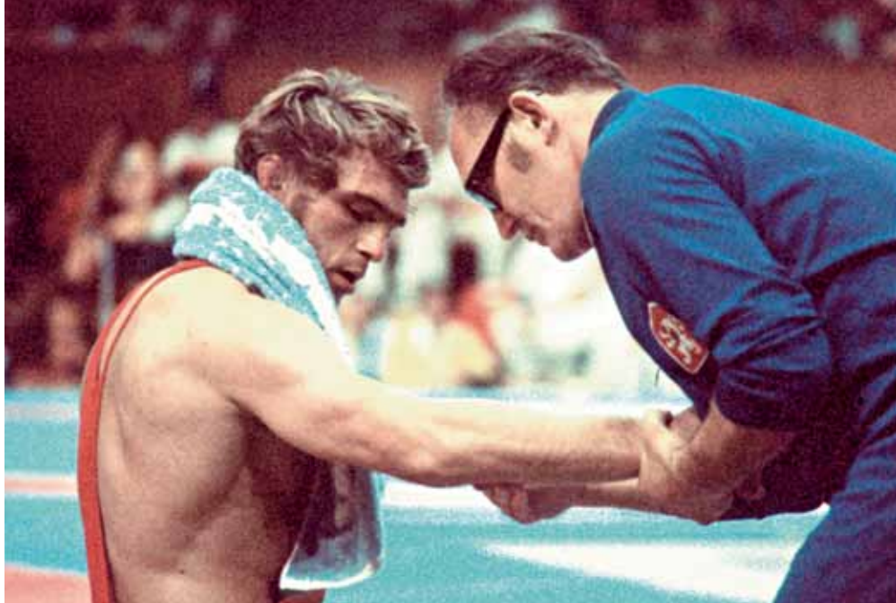
▲ Celou sportovní kariéru Máchu provázely pravidelně až neuvěřitelné zdravotní potíže. Olympiádu v Mnichově 1972 vyhrál i se zraněným ramenem, ve finále mistrovství Evropy 1974 si zlomil žebro, na OH v Montrealu 1976 (na snímku), kde vybojoval stříbro, ho trápily loket a koleno.