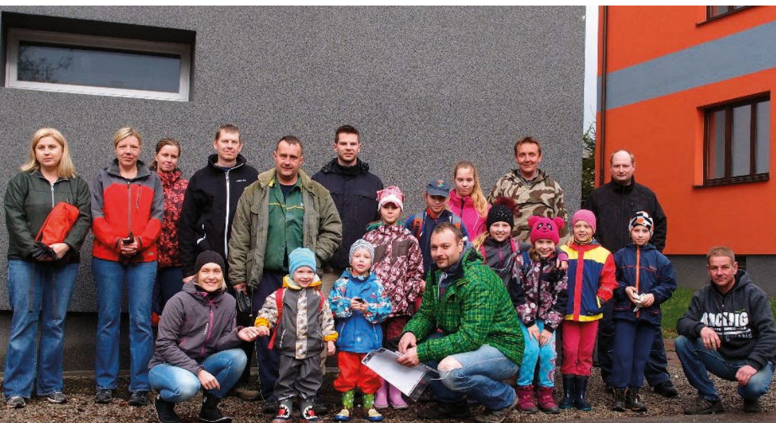
Uklidme Krmelín 8. 4. 2017