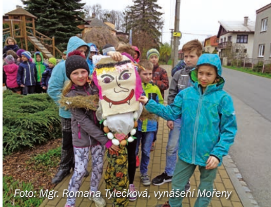
vynášejí Mořeny