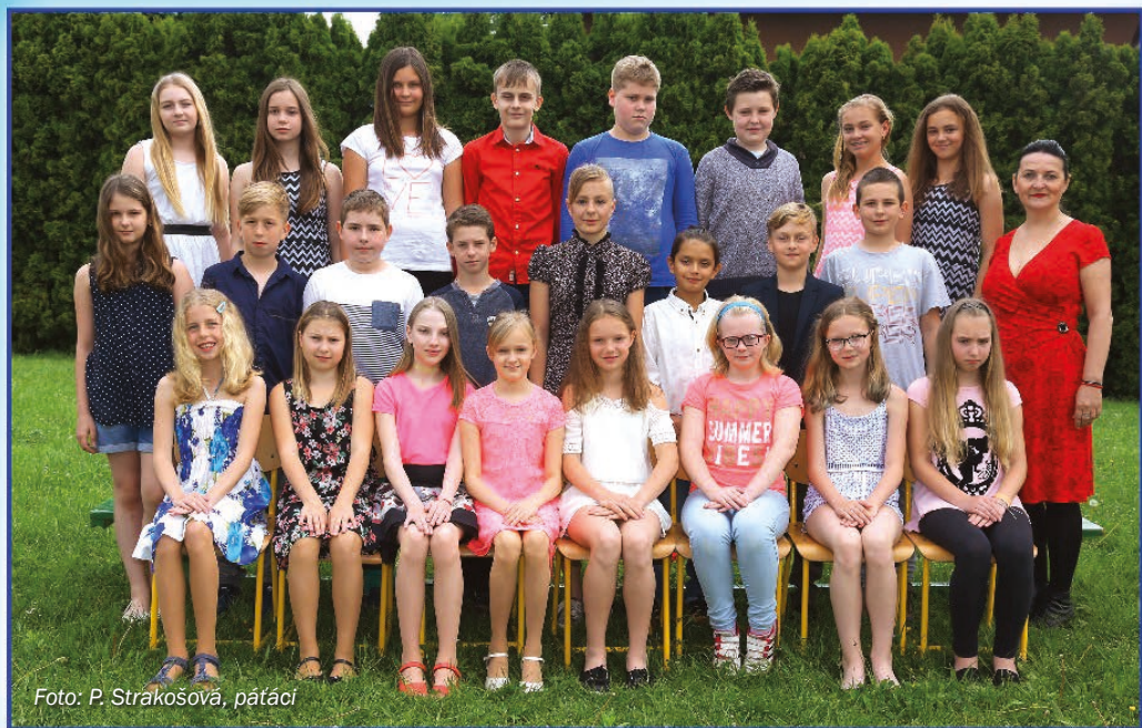
pářáci

Základní škola T. G. Masaryka Krmelín 5. třída 2016-2017