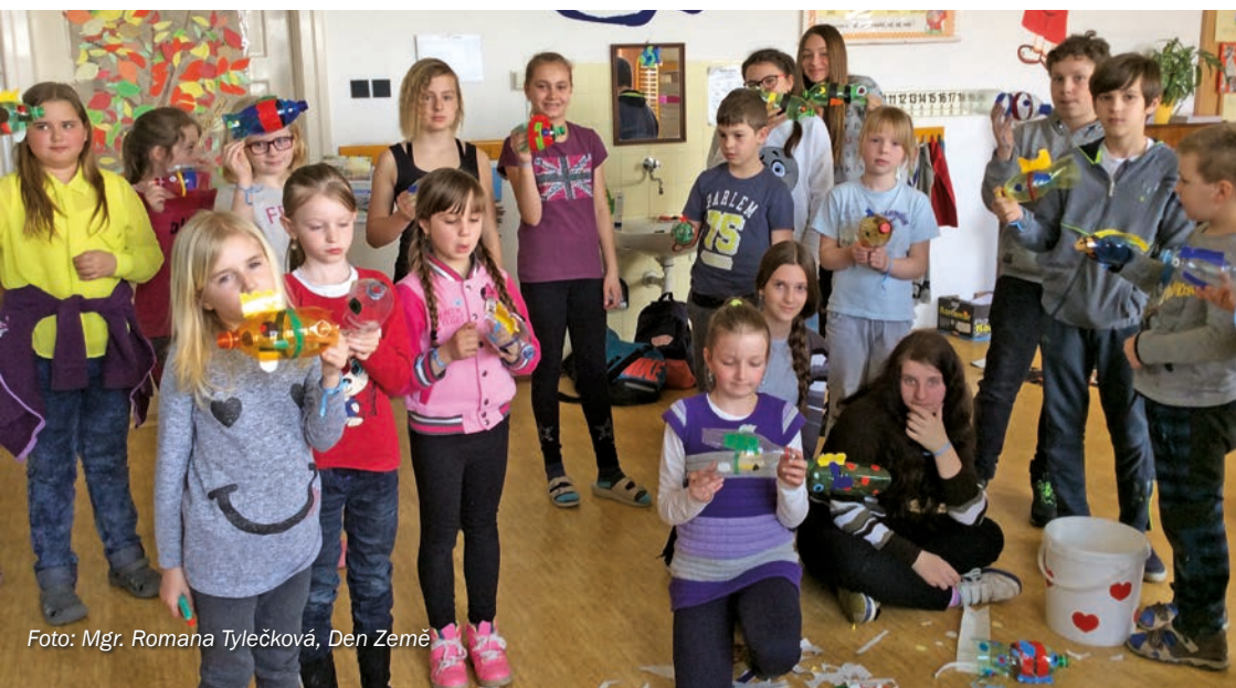
Den Země