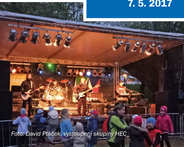
vystoupení skupiny HEC