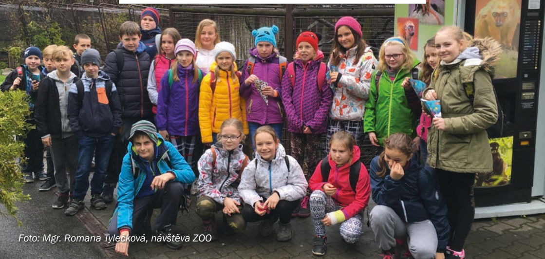
návštěva ZOO