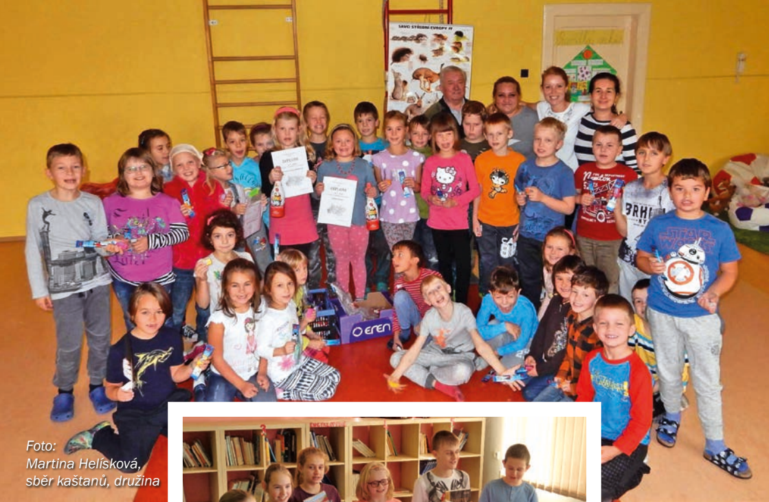
sběr kaštanů, družina