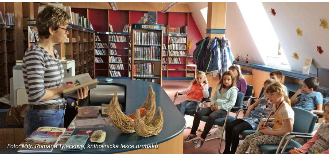
knihovnická lekce druháků