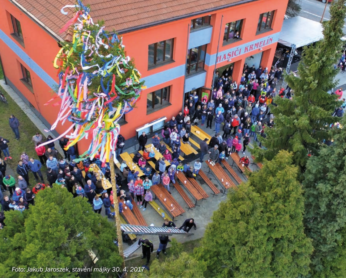
stavění májky 30. 4. 2017