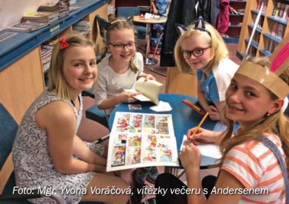
vítězky večeru s Andersenem